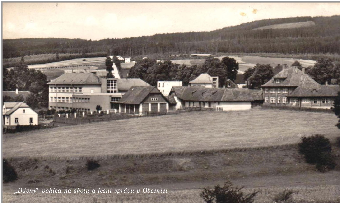
„Dávný“ pohled na školu a lesní správu v Obecnici