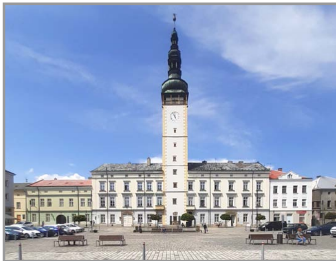
Litovel, náměstí Přemysla Otakara - budova radnice