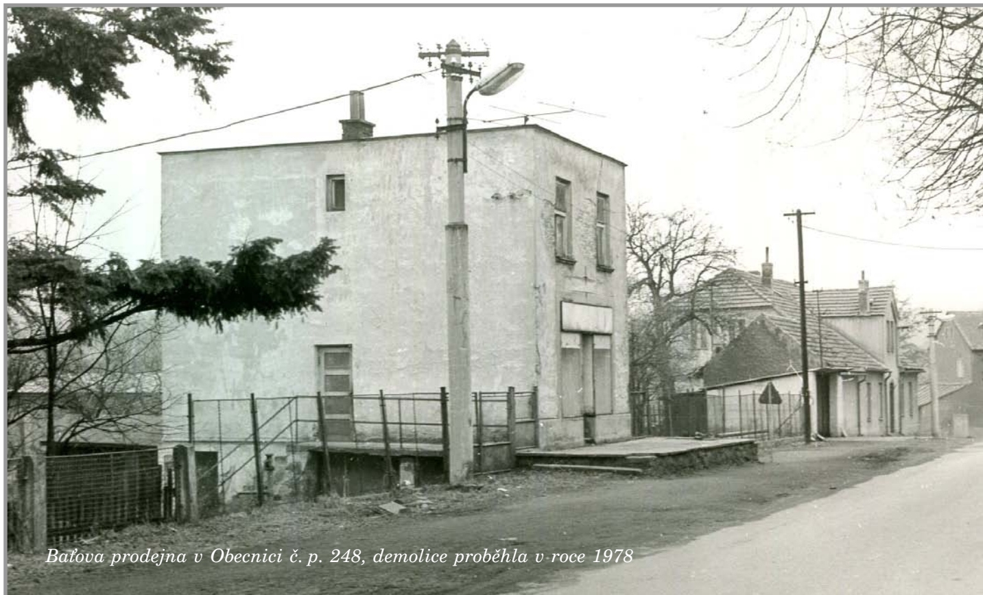
Bažova prodejna v Obecnici č. p. 248, demolice proběhla v roce 1978