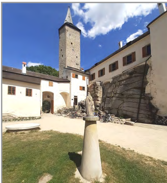
Horní část hradu