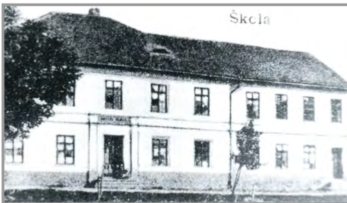
V roce 1871 dostavěla obec novou školu. Učilo se zde kolem 450 dětí. Dnes v budově sídlí obecní úřad.