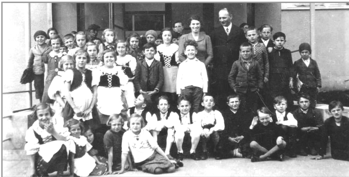
Školní léta 1938-39... 5. třída.