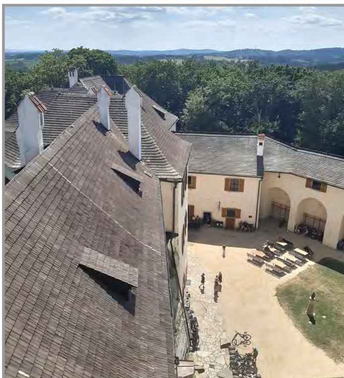
Výhled z hradní věže