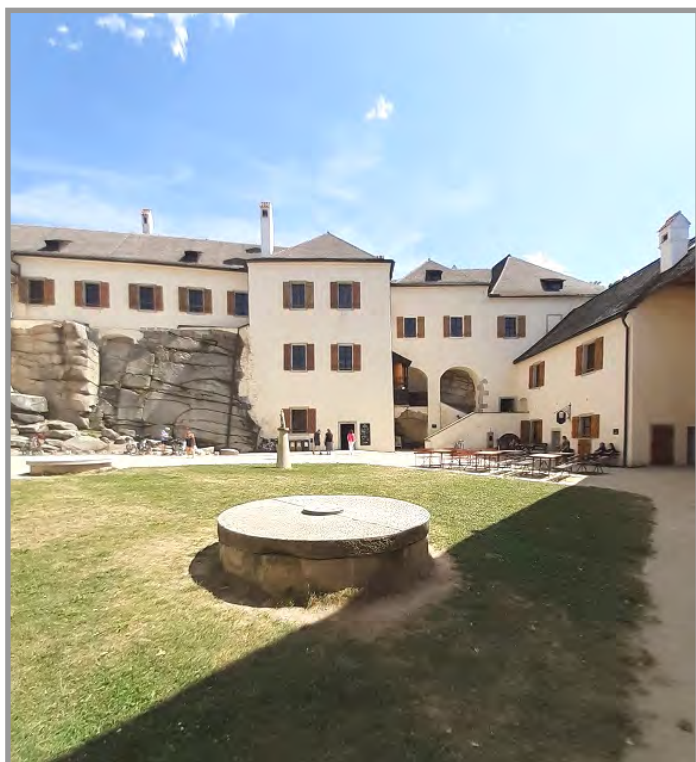
Dolní část hradu