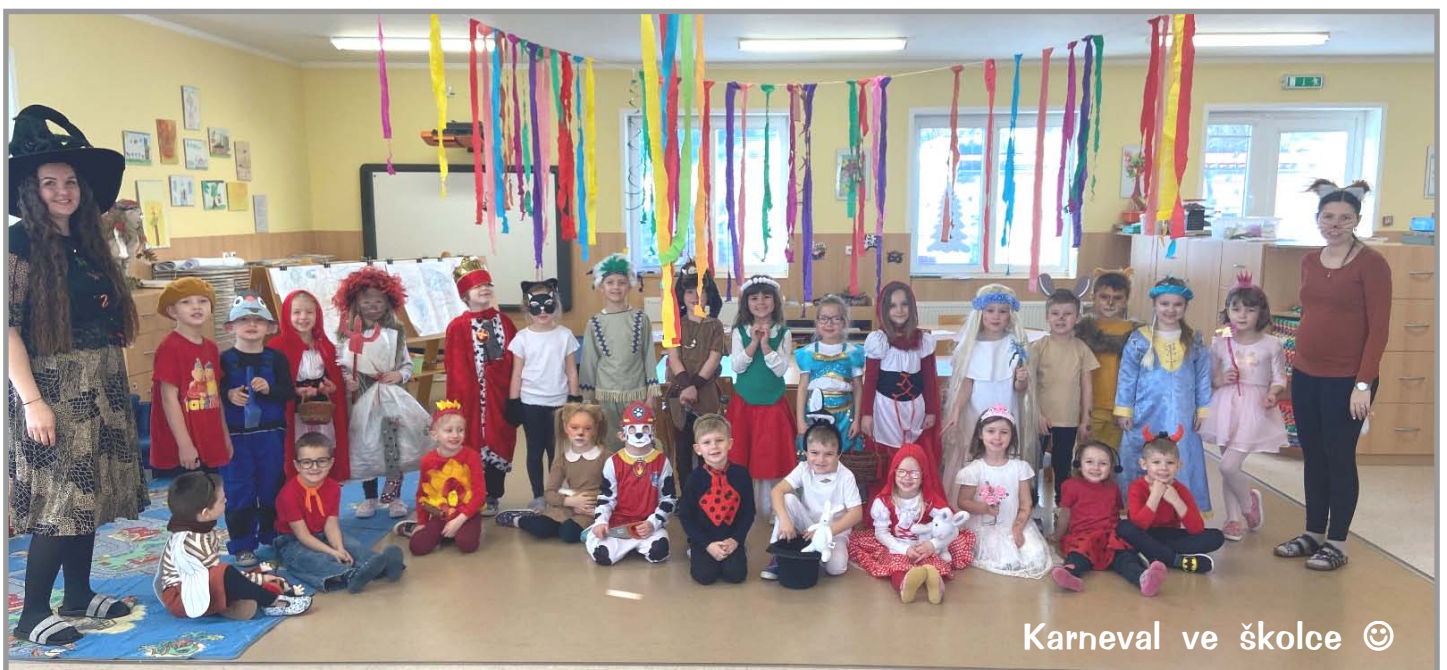
Karneval ve školce 😊