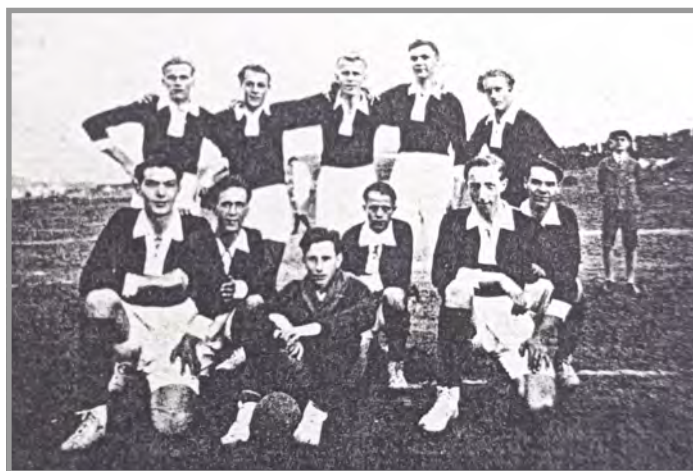
První průkopníci sportu... SK Slavoj Obecnice (rok 1930).