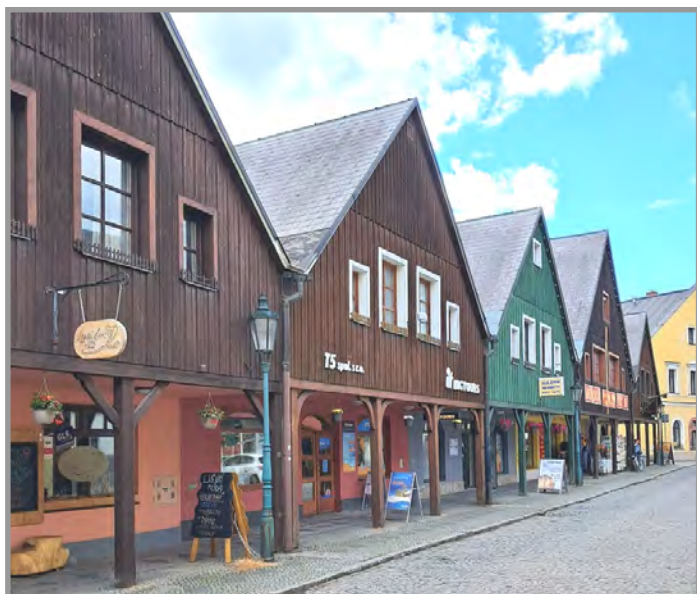
Vrchlabí - původní zástavba v ulici Zámecká