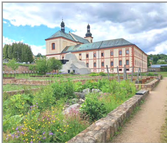
Vrchlabí - klášter obutých augustiniánů