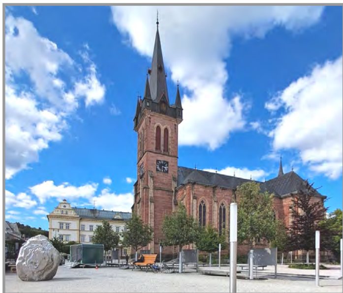
Vrchlabí - kostel sv. Vavřince