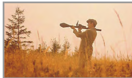
Z filmu „Obecná škola“

lení došlo v dubnu v roce 1942 po zřízení střelnice Werkmachtu a jejím rozšiřováním. Tak byly vysídleny obce a osady Přední a Zadní Záběhlá, Padrt', Kolvín, Skořice, Příkosice, Štítov, Trokavec, Pančava, Dražka, Hořice, Víšky, Myť, Velcí a jejich vysídlení skončilo v roce 1943. Výjimkou byl jen Kolvín, kde v pracovním táboře sídlilo postupně až 700 osob. Brdy byly totiž v roce 1941 postiženy větrnou kalamitou, kterou bylo nutné zlikvidovat. Proto zde byla zřízena úzkokolejka, po které se sváželo dřevo na pilu do Mirošova. Po skončení války se vraceli vystěhovalci do polozičených obcí a pustili se do opravy zplundrovaných usedlostí s vírou, že vesnice kráčí vstříc lepším zítřkům, jak začala hlásat komunistická strana, která se dostala k moci. V roce 1940 se Němci nikoho neptali a vydali rovnou rozkaz k vystěhování, ve druhém případě bylo jednáno jakoby demokraticky. Byla svolána schůze do Hořovic, na kterou byli pozváni zástupci vybraných brdských obcí, aby s nimi byly projednány plány vysídlení. Příčinou rozšíření prostoru měla být příprava agrese západních imperialistů proti táboru míru. Posléze ti, kteří odmítali dobrovolně podepsat vysídlení, byli označeni jako třídní nepřátelé, se všemi dalšími následky. A v následujícím roce začala likvidace domků, zahrad, školy, kapličky ba i pomníků padlých v Kolvíně i Padrti. Ze Záběhlé se podařilo pomníky padlých několika