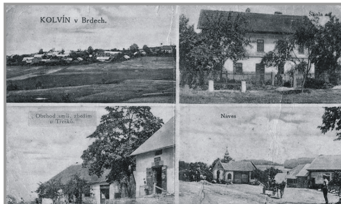
Kolvín v Brdech