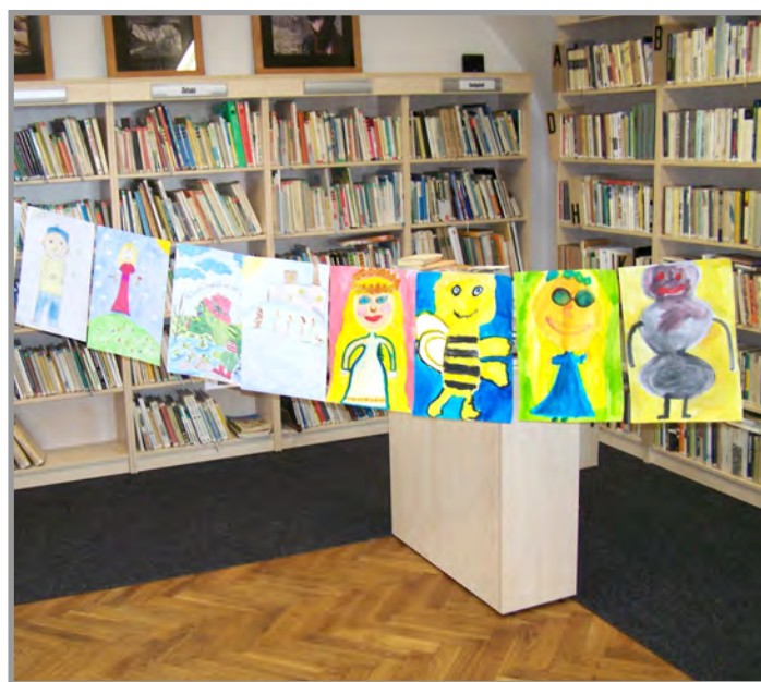
Knihovna - výtvarná výstava dětí