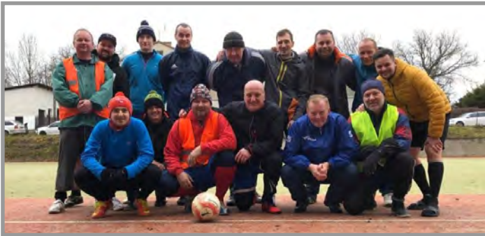
Silvestrovský fotbálek áčka