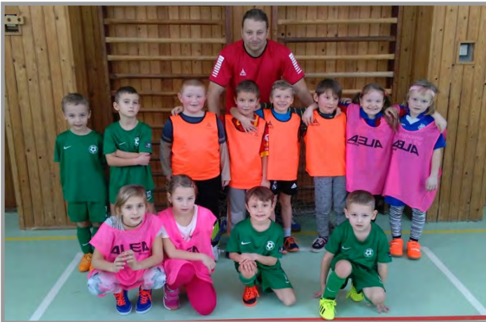
Trénink fotbalové školičky s hráči 1.FK Příbram