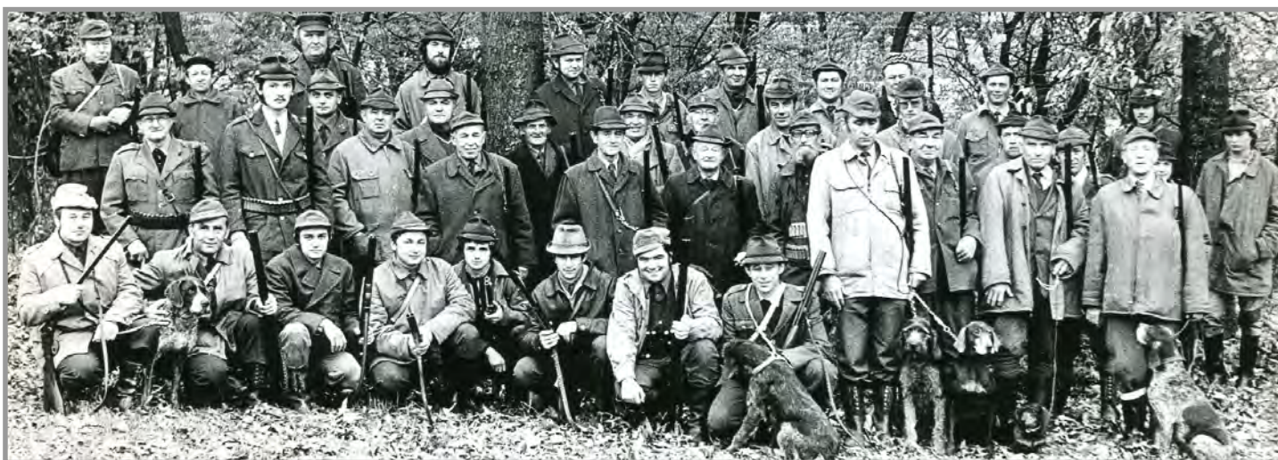
Myslivci z Obecnice a okolí... (z roku 1978)