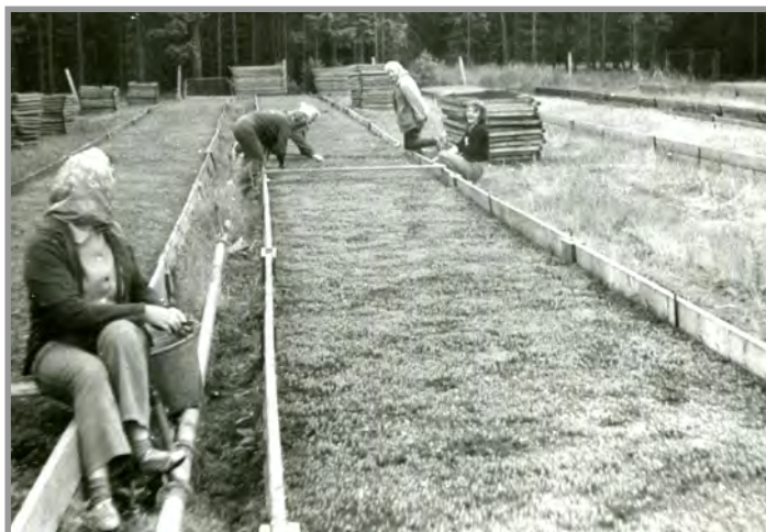
Semenišť, lesní školka v Obecnici.