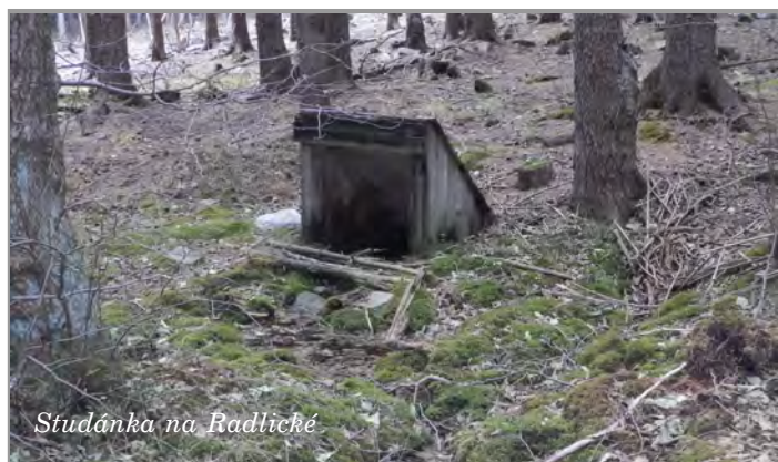
Studánka na Radlické