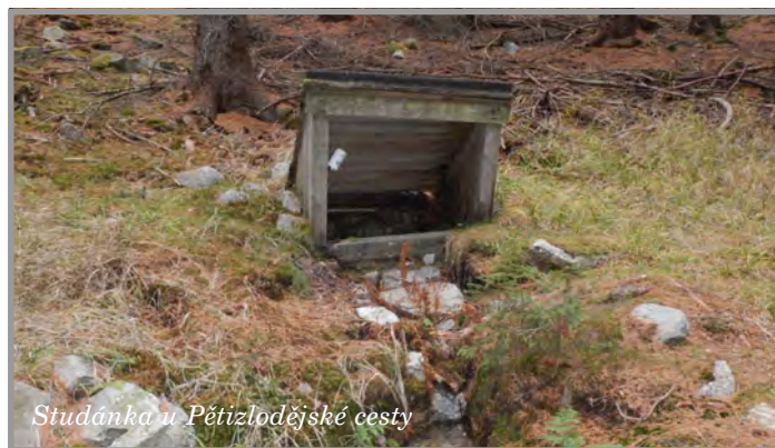
Studánka u Pětizlodějské cesty