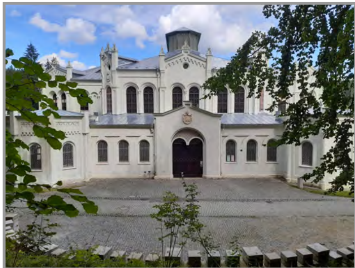
Světce - Windischgrätzova jízďárna