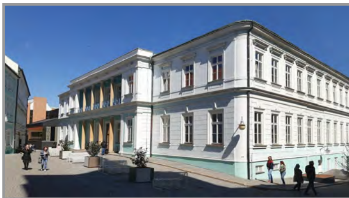
Lázeňský dům Pravřídlo