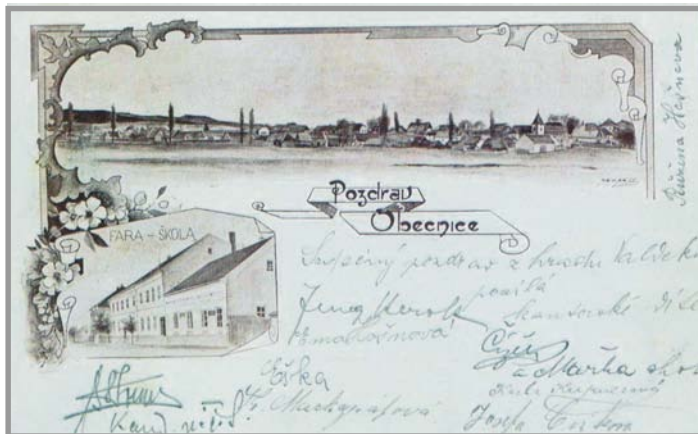
Pohled na obec ze západu a fara se školou. Pohled z roku 1901.