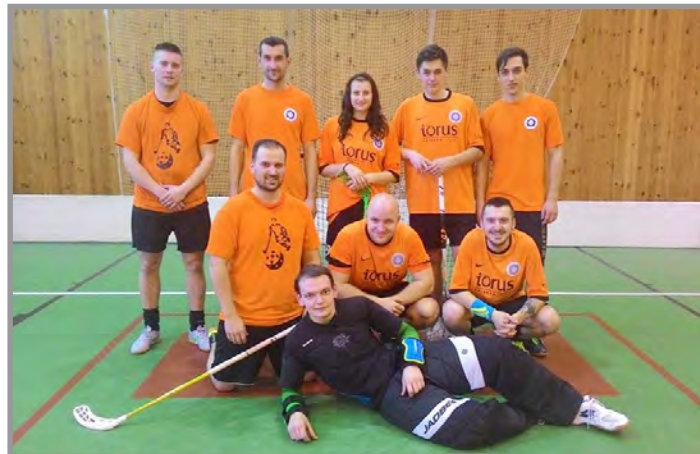
Vánoční turnaj v Jincích, 4. místo.