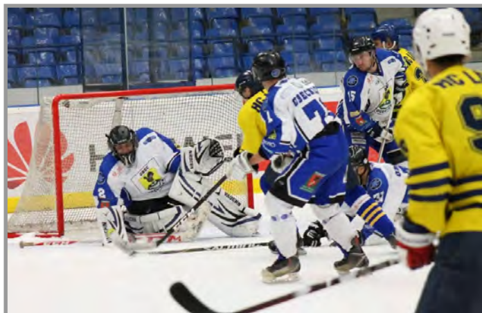
18. kolo 5. 3. Obecnice – Černošice "B" /17.00 hod. ZS Příbram/