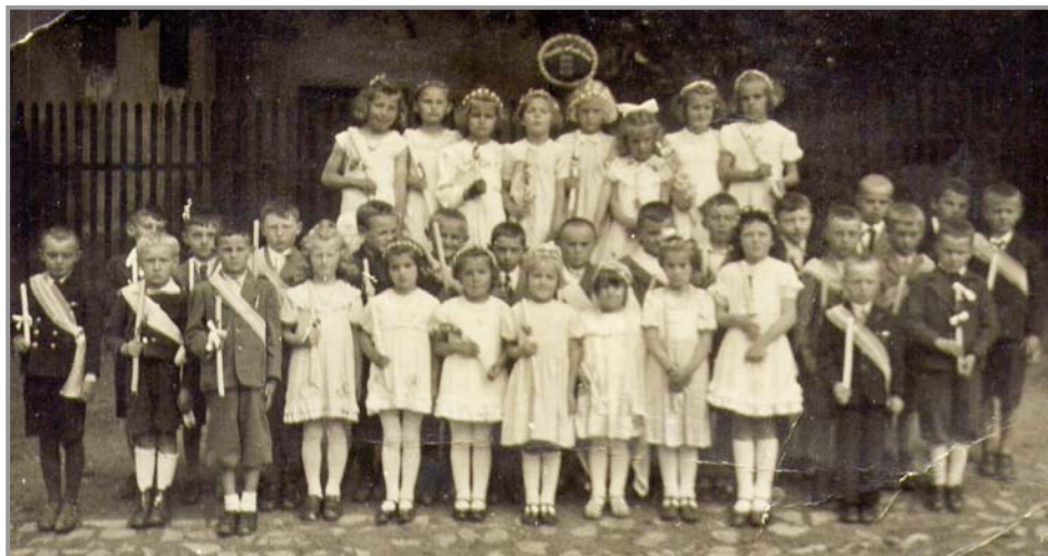
Děti u kostela (rok 1940)

Pan Láďa Lukáš mi poslal před časem do archivu také letité fotografie, u kterých nevíme o koho se jedná. Pokud by někdo z vás lidi na snímku poznal, dejte vědět do redakce (tedy mně) nebo na OÚ. bs