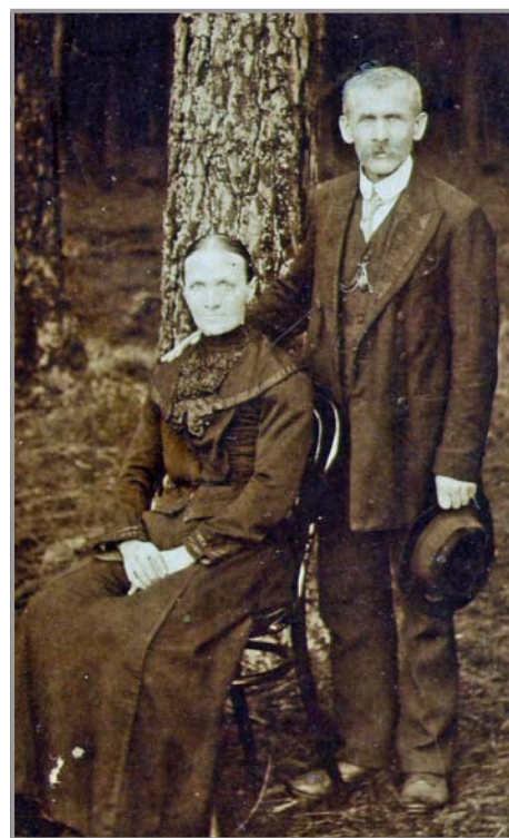
Poznáte, kdo je na fotografii?