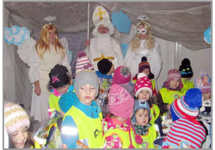
Děti byly u Mikuláše a čerta na faře...