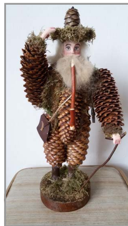
Za foto tohoto Fabiána děkuji paní Štochlové z Oseče.