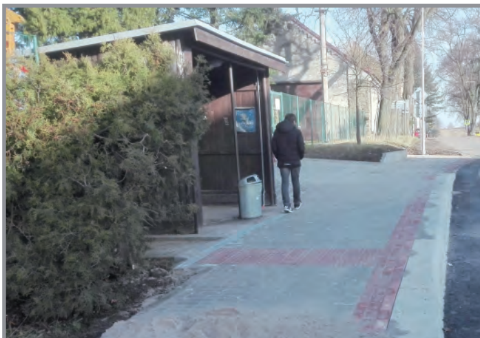
Zastávka autobusu na Drahlín