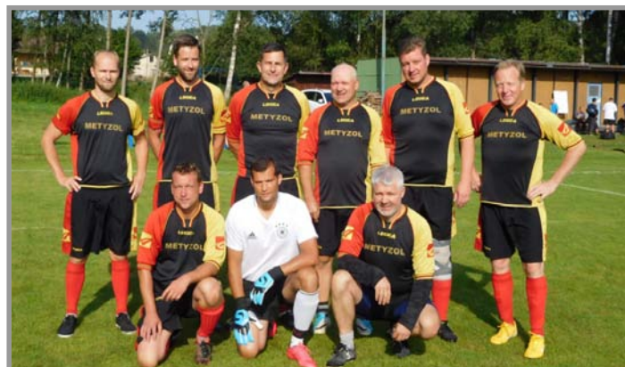
Mužstvo Slavoj Obecnice