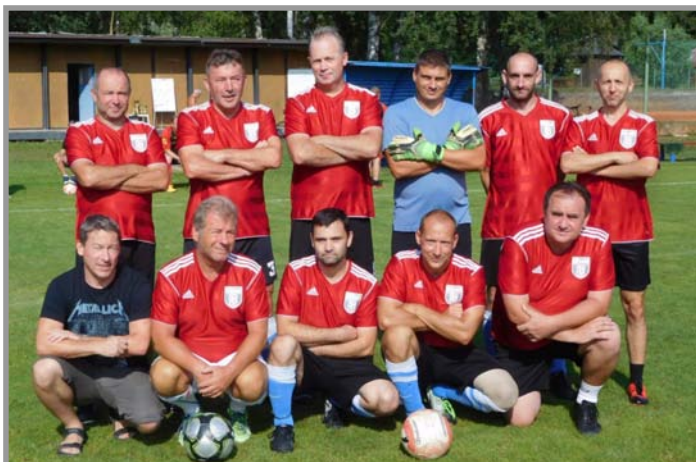
Vítězné mužstvo Sokol Drahlín