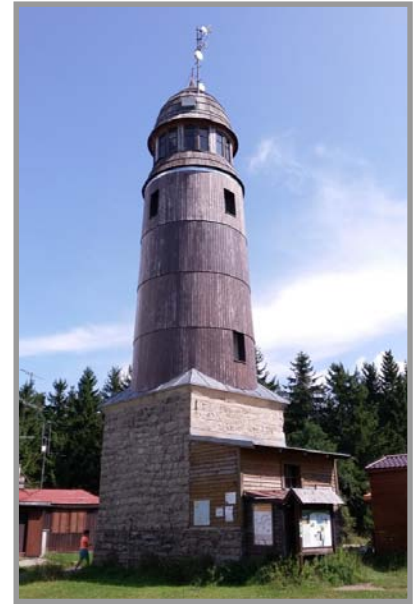
Rozhledna na Blatenském vrchu