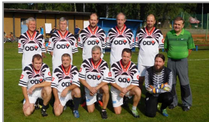
Mužstvo TJ Zaječov