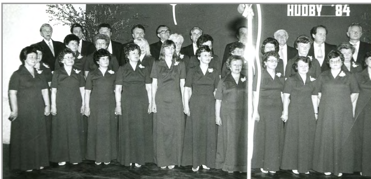
Celovečerní koncert pěveckého sboru Přátelství v sále hostince U Zelenků v Obecnici (4. 5. 1984).