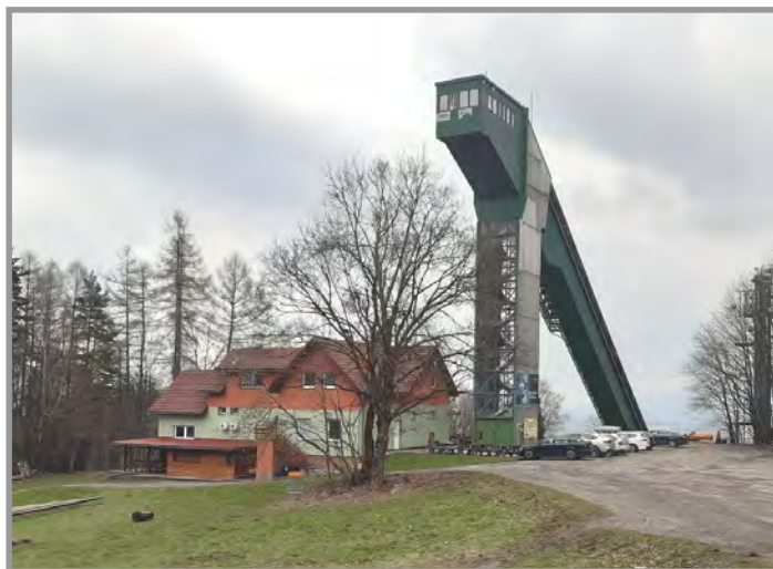
Frenštát pod Radhoštěm - areál Horečky