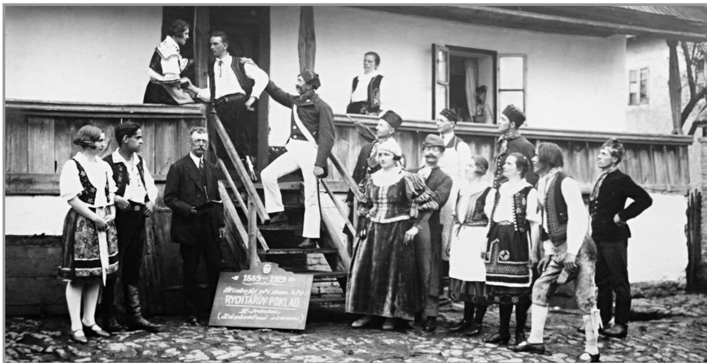
Text viz cedule na fotografii „1889–1929 ... Účinkující při slavn. hře RYCHTÁŘŮV POKLAD ... II. jednání (závěrečná scéna).