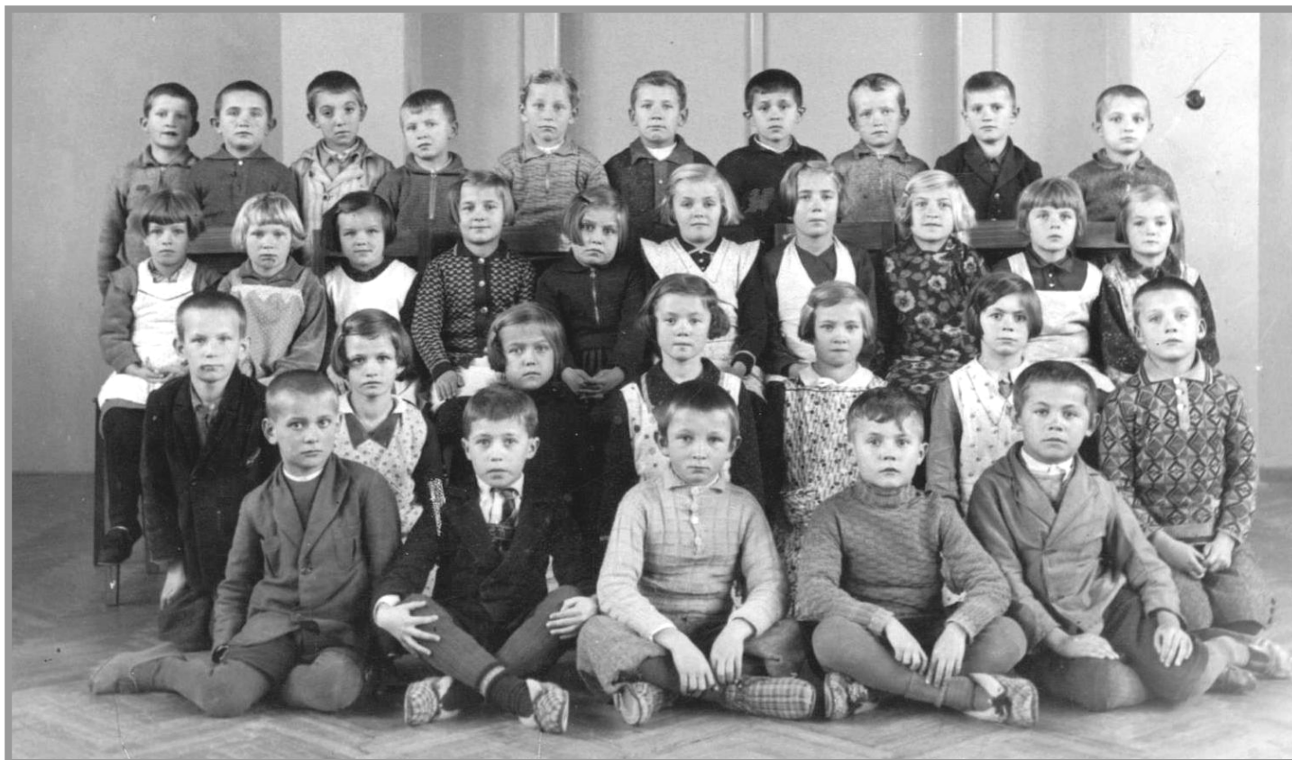
Školní léta 1938-39 v obecnické škole.