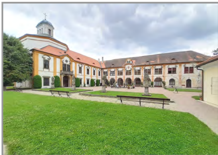
Zámek Choltice, okr. Pardubice