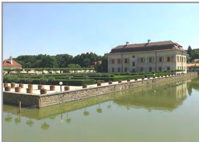
Zámek Kratochvíle, okr. Prachatice