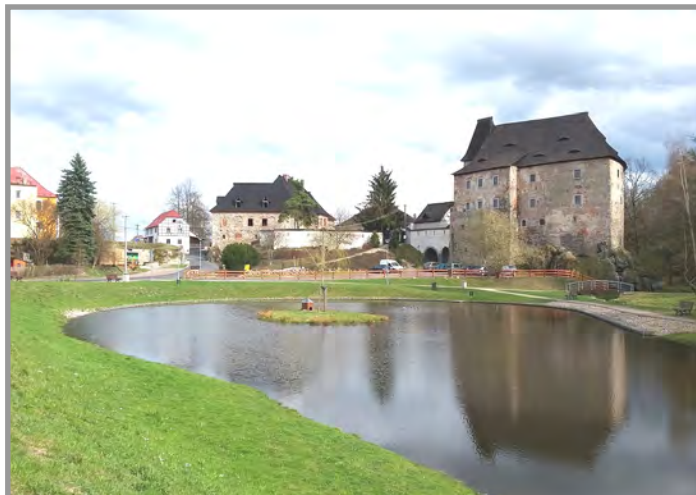
Hrad Vildštejn, okr. Cheb