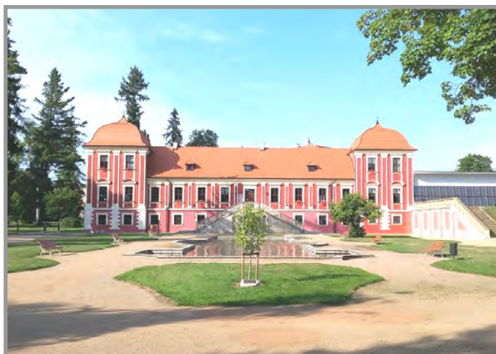
Zámek Ostrov nad Ohří, okr. Karlovy Vary