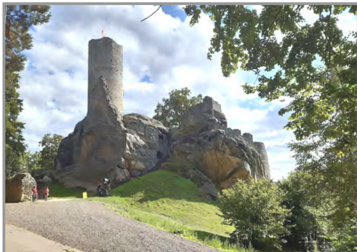
Hrad Frýdštejn, okr. Jablonec nad Nisou