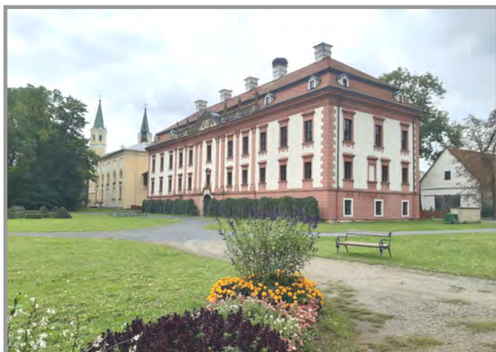
Zámek Kunín, okr. Nový Jičín