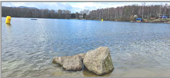
Celkový pohled na jezero Kristýna. V horním pravém rohu je vidět nástupní molo do vody.