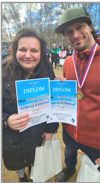
A zde jsou, oba reprezentanti, kteří na dálném severu ukázali, že Obecnice má kvalitní sportovní klub, který ohrozí i ostrálené borce z velkých týmů.

Z celkového počtu 114 týmů zimního plavání se náš OBECNICKÝ KLUB OTUŽILCŮ umístil na krásném 33. místě . Nabírali jsme 910,5 bodů , měli jsme celkem 17 startů při našich 4 plavcích. Startovali jsme celkem na 5 soutěžích: v Lulči na Moravě, v Holoubkově, v Plzni, na Sázavě a v Hrádku nad Nisou. A co jsme si přivezli?