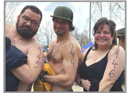
Náš tým, těsně po očíslování...

nivější, nicméně stále velmi osvěžující: Vzduch 10 °C, voda 7,3 °C. Defakto skoro jarní hodnoty. Do vody se nikomu moc nechtělo a všichni otáleli. Ale start se blížil. Vlezli jsme tam... dno bylo příjemné, voda čistá, ale pocitově studená.