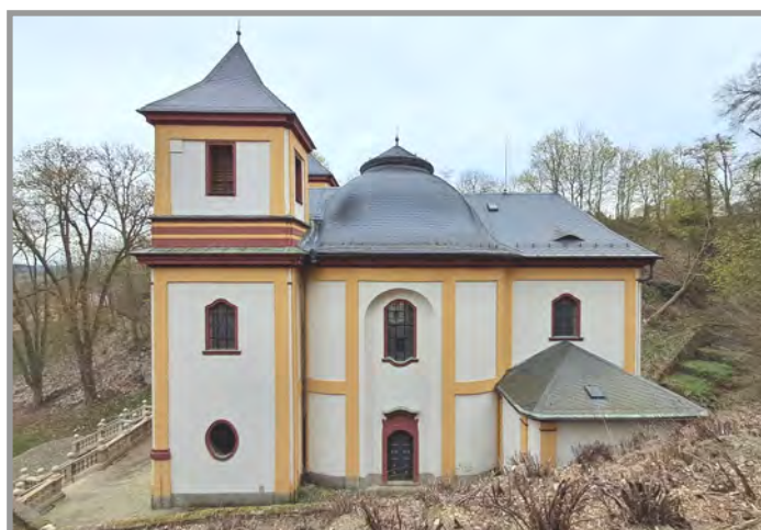
Poutní kostel sv. Mikuláše