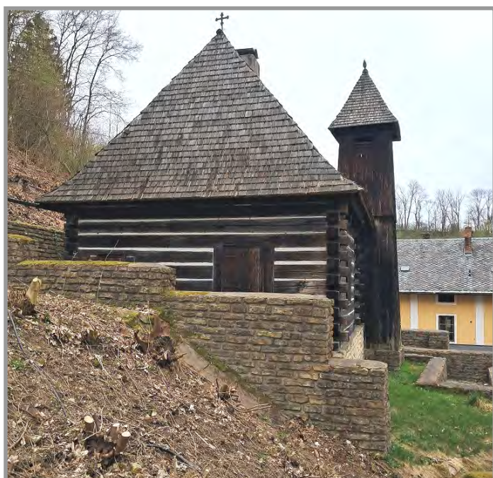
Poustevna byla zrušena v roce 1782