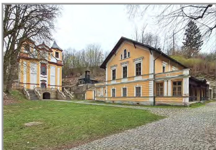
Poutní kostel, poustevna a bývalé lázně