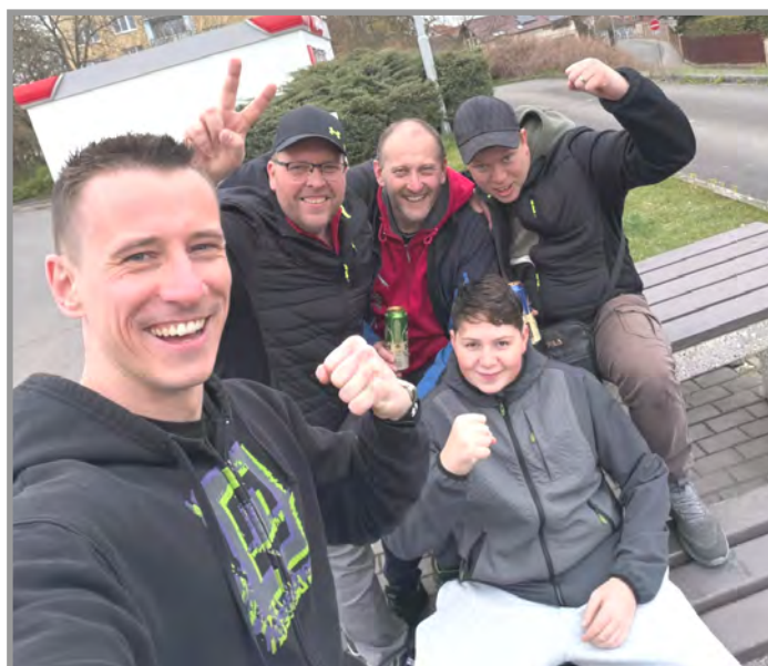
Po vítězství v Rakovníku a postupu do další fáze)

KST Rakovník „A“ - TJ Slavoj Obecnice „A“ 7:9 (body Obecnice – Vrátný 4, Sýkora 3, Dlouhý 2)